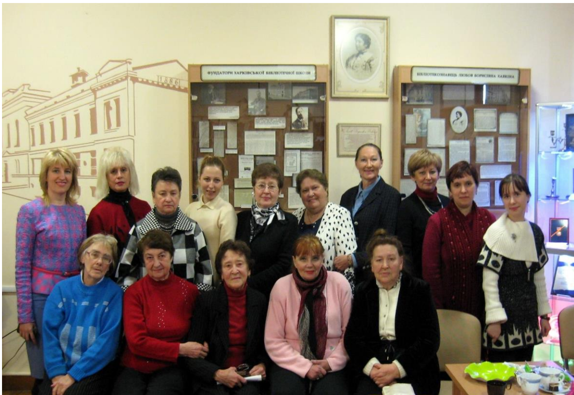
Зустріч бібліотекарів із ветеранами ХДНБ (1960-х рр.) у рамках циклу «Бібліотечний четвер». м. Харків, жовтень 2015 р.